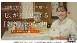
50冊で始めた小さな本屋から広がる「好き」のつながり。 | 移動式本屋「か... 3.9万回視聴・1か月前