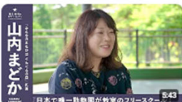
「日本で唯一動物園が教員のフリースクール」 | みんなのまなびはぐくるの森 / 代表... 5.9万回視聴・1年前