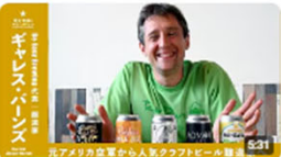
「元アメリカ空軍から人気クラフトビール醸造家へ」 | Be Easy Brewing代表 | ガレス... 7442回視聴・3年前