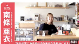
「学生起業で商店街の空き家を交流拠点に変えていく」 | YOKOSAWA CAMPUS / ... 753回視聴・2年前