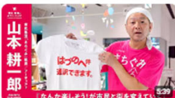
「なんかせしもう」が市民と街を愛していく | 市民集団「まちくみ」 社長 / アーティ... 351回視聴・1年前