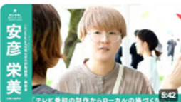
「テレビ番組の制作からローカルの増つくりへ」 | communeAOMUSHI株式会社 取締役 / ... 332回視聴・1年前