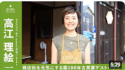
「商店街を元気にする第100年古民家ゲストハウス」 | なり -nuttari NARI-オーナー | 高江... 2495回視聴・3年前