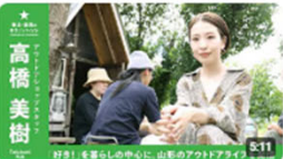
「好き!」を暮らしの中心に。山形のアウトドライブを発信 | アウトアショップ... 2977回視聴・3年前