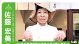
「女性の農業活躍が福島の食と農を豊かにする!」 | GoodDayMarket 主催 / 一般社団法人... 406回視聴・2年前