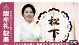
「会える秋田美人」 | 舞妓文化の継承を支える名実方 | 株式会社せん「あきた舞妓」マネ... 1809回視聴・2年前