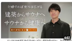
行動すれば世界は広がる。建築からサウナへ、サウナから健康へ | 株式会社HIJILI代... 3万回視聴・1か月前