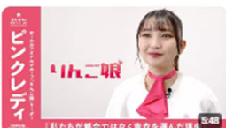
「私たちが東京ではなく青森を選ぶ理由」 | ロールアイドルグループ・りんご娘リダー... 7.3万回視聴・2年前