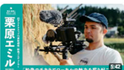
「映像の力でローカルの魅力を盛り起こす」 | 監アウトロップ代表取締役・映像プロデ... 519回視聴・2年前