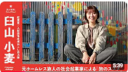
「元ホームレス旅人の社会起業家による旅のススメ」 | 起業家・大船渡市地域おこし協力... 1817回視聴・3年前