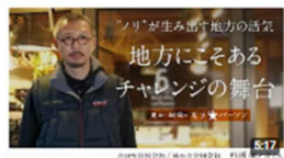
「ノリ」が生み出す地方の活気 地方にこそあるチャレンジの舞台 | 六日町合同会社 / ... 3.8万回視聴・3週間前