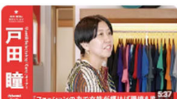
「ファッションの力で女性たちが輝けば環境も変わる」 | used & selectshop「Caro」 | オ... 1172回視聴・2年前