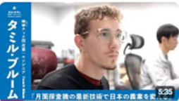
「月面探査機の最新技術で日本の農業を変える」 | 輝葉テック監代表・エンジニア | タミ... 471回視聴・2年前