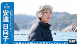
「石巻から全国の水産業をアップデートする」 | 一般社団法人フィッシャーマン・ジャ... 1033回視聴・1年前