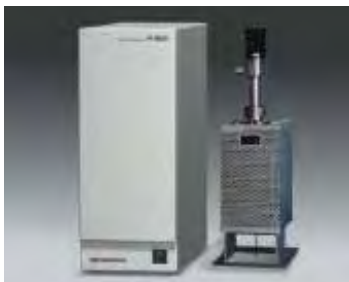
↑ダブルショット・パイロライザ ↑概観 →Ultra ALLOY®金属 キャピラリーカラム