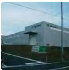
一 本 社 ・ 工 場

このノウハウを生かし、平成元年にワイン用キャップシール自動供給機を開発し、平成13年9月から錫製のキャップシールの製造販売を開始した。錫製キャップシールの市場は高級品だけに小さいが、国内でその技術と設備を備えているのは同社のみである。