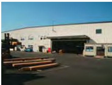
→平成18年8月に完成した製材工場内の景観