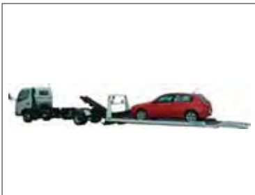
→超低スロープセフテローダのグレードⅢ一般積載車(中型クラス)