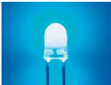
↑ LED ホワイト キャップ