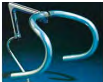
ハンドルグリップ