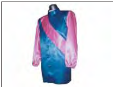
一月に約七〇枚の勝負服を製作。