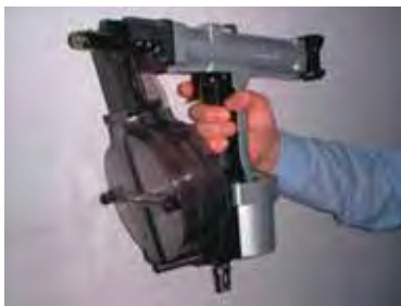
リベット自動連結機